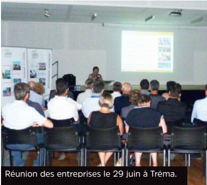
Réunion des entreprises le 29 juin à Tréma.

Le jeudi 22 juin, la Com'com a réuni toutes les entreprises du territoire pour présenter l'activité économique actuelle et échanger avec les représentants du syndicat mixte Mégalis, chargé du plan régional Très Haut Débit (THD), sur l'enjeu du déploiement du THD et la fibre optique sur le Pays de Châteaugiron Communauté et son calendrier.