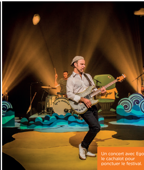
Un concert avec Ego le cachalot pour ponctuer le festival.

D éjà dix ans ! Le festival E'MÔM'Tions a su creuser son sillon pour s'inscrire dans la durée. En 2008, les élus de Châteaugiron ont eu la bonne idée de programmer des animations annuelles pendant les vacances de la Toussaint, une période peu propice aux migrations vers les plages ou les pistes alpines !