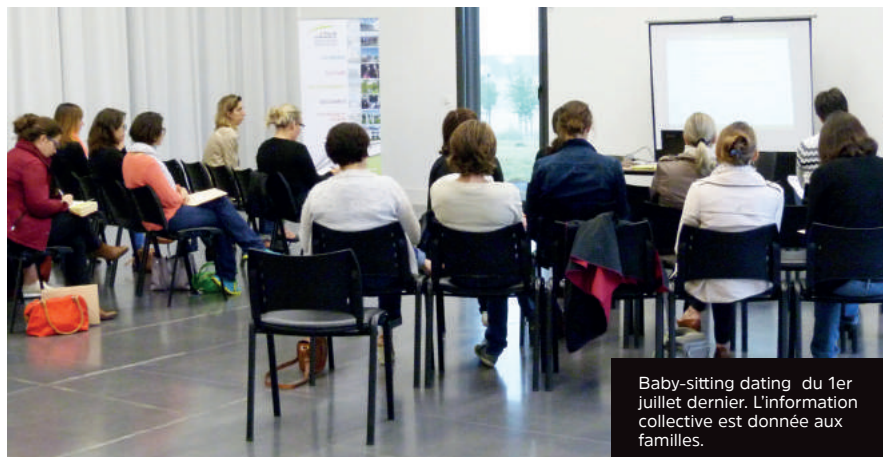
Baby-sitting dating du 1er juillet dernier. L'information collective est donnée aux familles.

Le Point Accueil Emploi (PAE) et le Service Information Petite Enfance (SIPE) ont animé une information collective sous forme d'atelier quelques jours avant le Baby-sitting dating du 1 er juillet. Les candidats ont pu commencer à faire le point sur leur profil grâce à une fiche support transmise à chacun et l'aide des conseillères emploi et SIPE. L'objectif était de bien préparer les candidats aux futurs entretiens surtout dans le cadre d'un job dating.