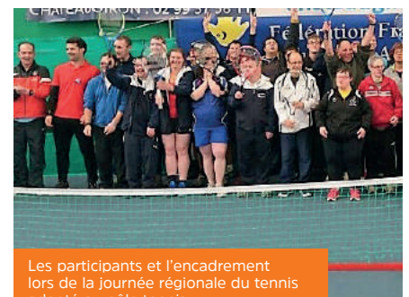
Les participants et l'encadrement lors de la journée régionale du tennis adapté au pôle tennis.

Renseignements et inscriptions : Tennis Club du Bois Orcan Le Patis Hidouze - 35410 Châteaugiron 02 99 00 57 35 tc.bois.orcan@gmail.com ou s'adresser à la Com'com : 02 99 37 67 68