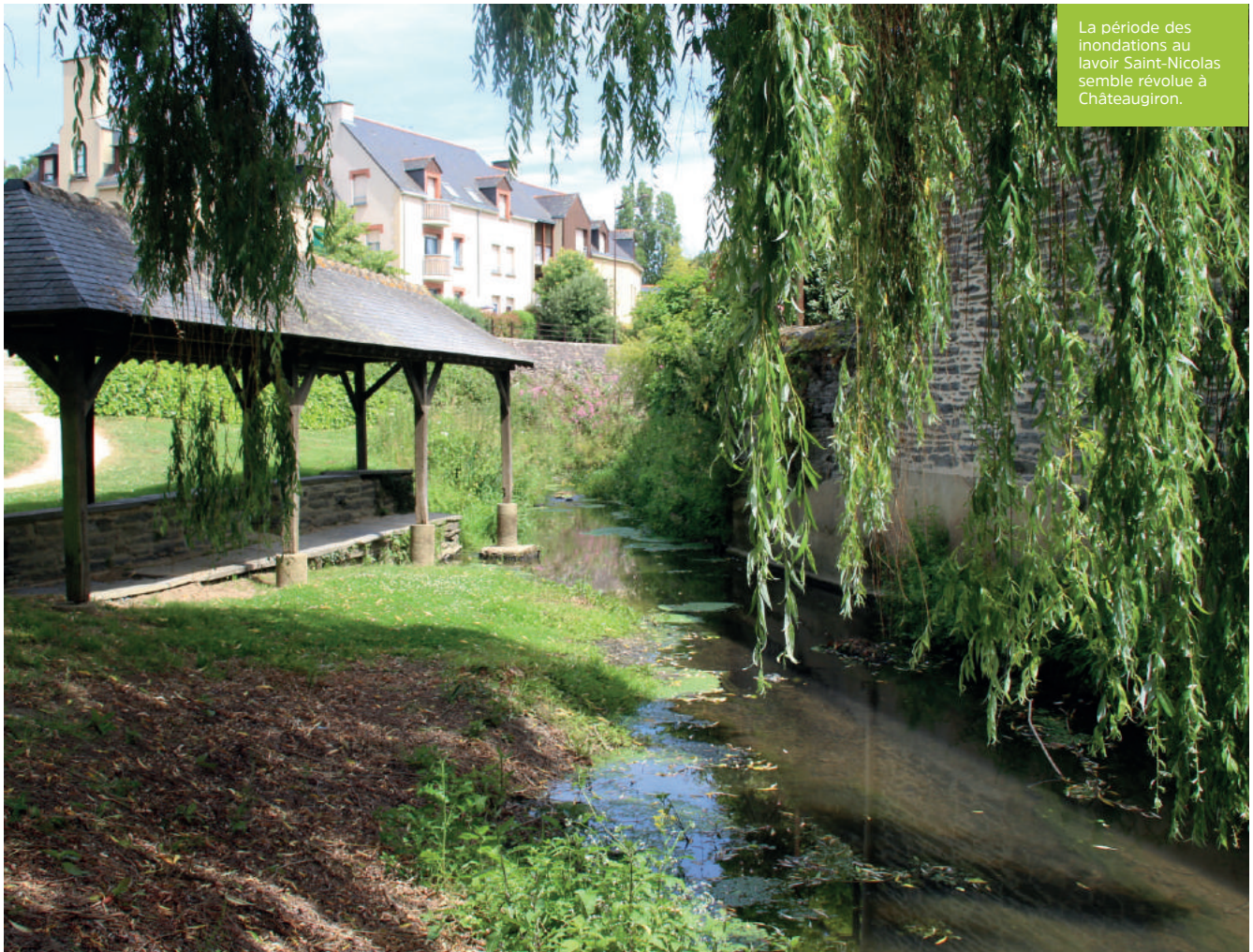
La période des inondations au lavoir Saint-Nicolas semble révolue à Châteaugiron.

vallier avec ces deux structures car il faut agir à une échelle efficace tout le long des cours d'eau ", poursuit Julie. Concrètement la Com'com prend la compétence et les syndicats exécutent les choix des élus locaux. Un seul décideur l'interco sur un seul échelon local.