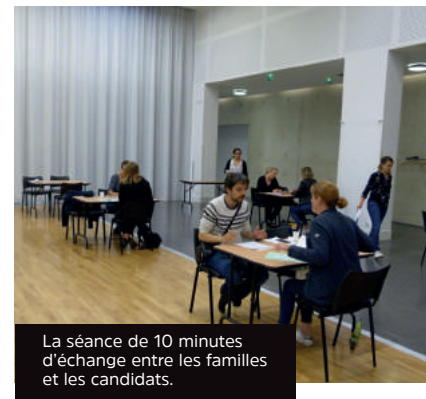
La séance de 10 minutes d'échange entre les familles et les candidats.