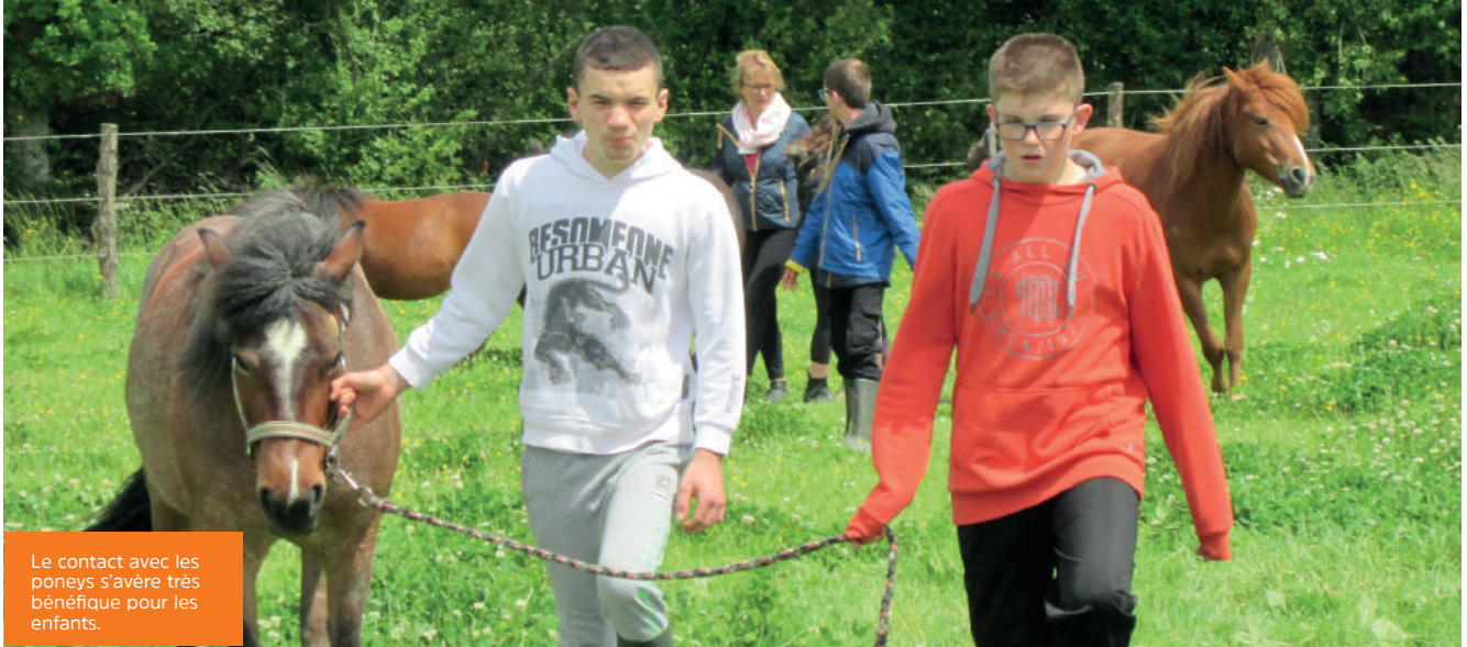
Le contact avec les poneys s'avère très bénéfique pour les enfants.

Depuis septembre 2016, onze élèves se rendent, le vendredi, à la ferme équestre de Saint-Aubin-du-Pavail. Une activité très bénéfique pour ces enfants en difficulté.