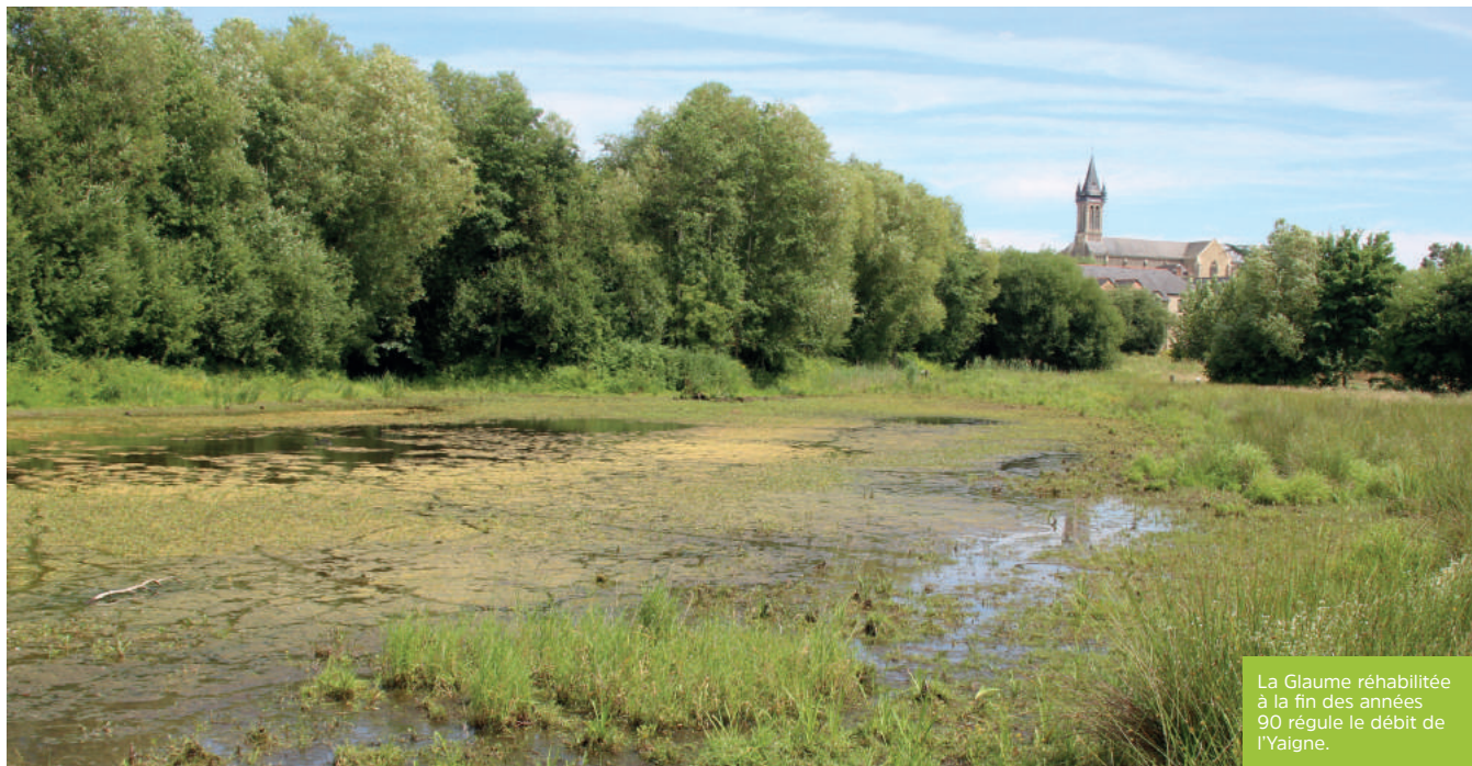
La Glaume réhabilitée à la fin des années 90 régule le débit de l'Yaigne.

Une grande responsabilité et un vaste chantier.