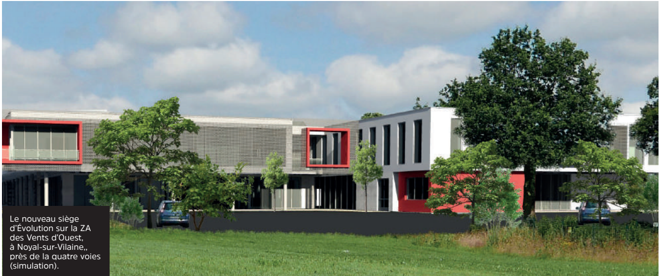
Le nouveau siège d'Évolution sur la ZA des Vents d'Ouest, à Noyal-sur-Vilaine,, près de la quatre voies (simulation).

250 emplois supplémentaires sur la Com'com.