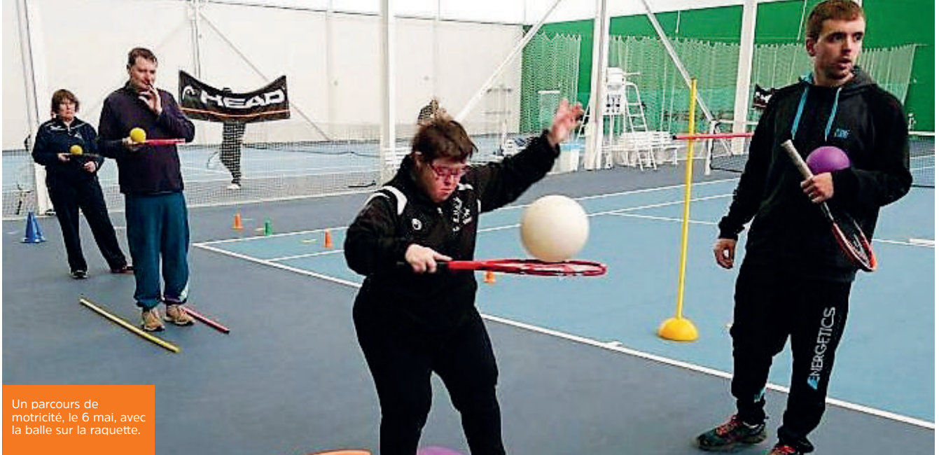
Un parcours de motricité, le 6 mai, avec la balle sur la raquette.

Le Tennis Club du Bois Orcan accueille cette rentrée des travailleurs handicapés de l'ESAT* de la Mabilais à Noyal-sur-Vilaine.