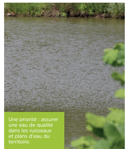
Une priorité : assurer une eau de qualité dans les ruisseaux et plans d'eau du territoire.

*Loi Maptam ou loi de modernisation de l'action publique territoriale et d'affirmation des métropoles.