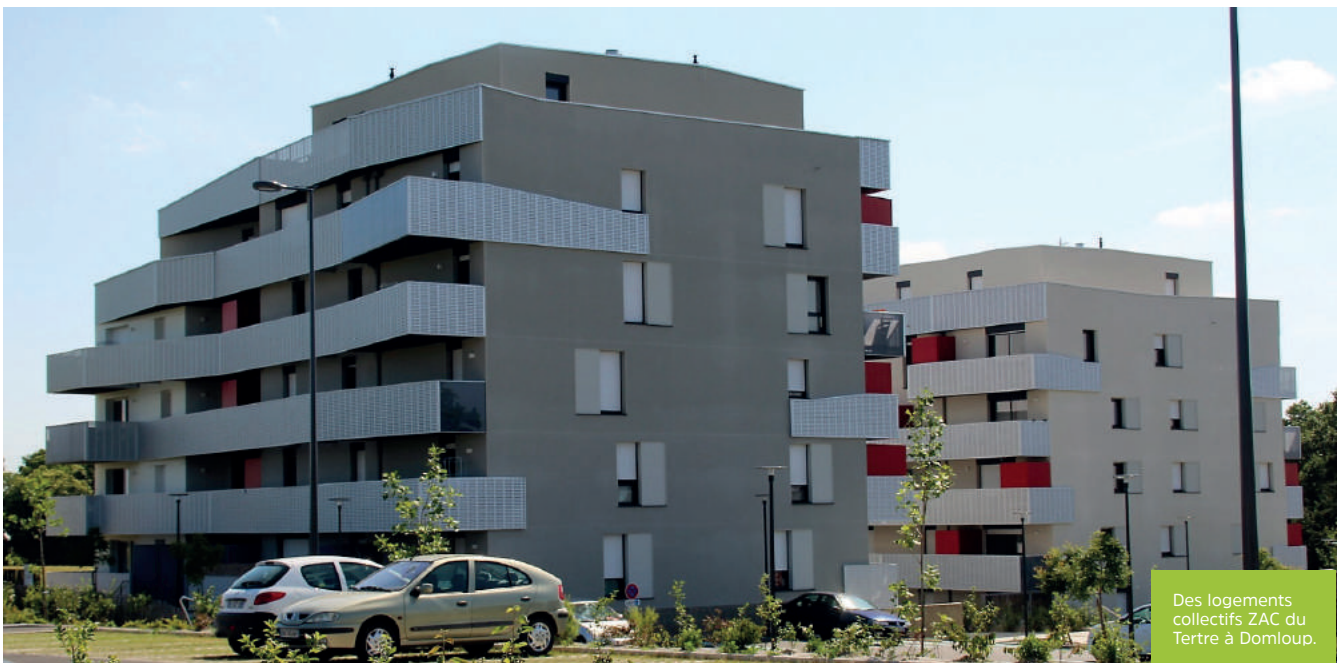
Des logements collectifs ZAC du Tertre à Domloup.