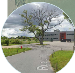
Illustration d'un parvis dans une zone artisanale permettant la mutualisation de services tels que les zones de déchargement et le stationnement visiteurs des entreprises.