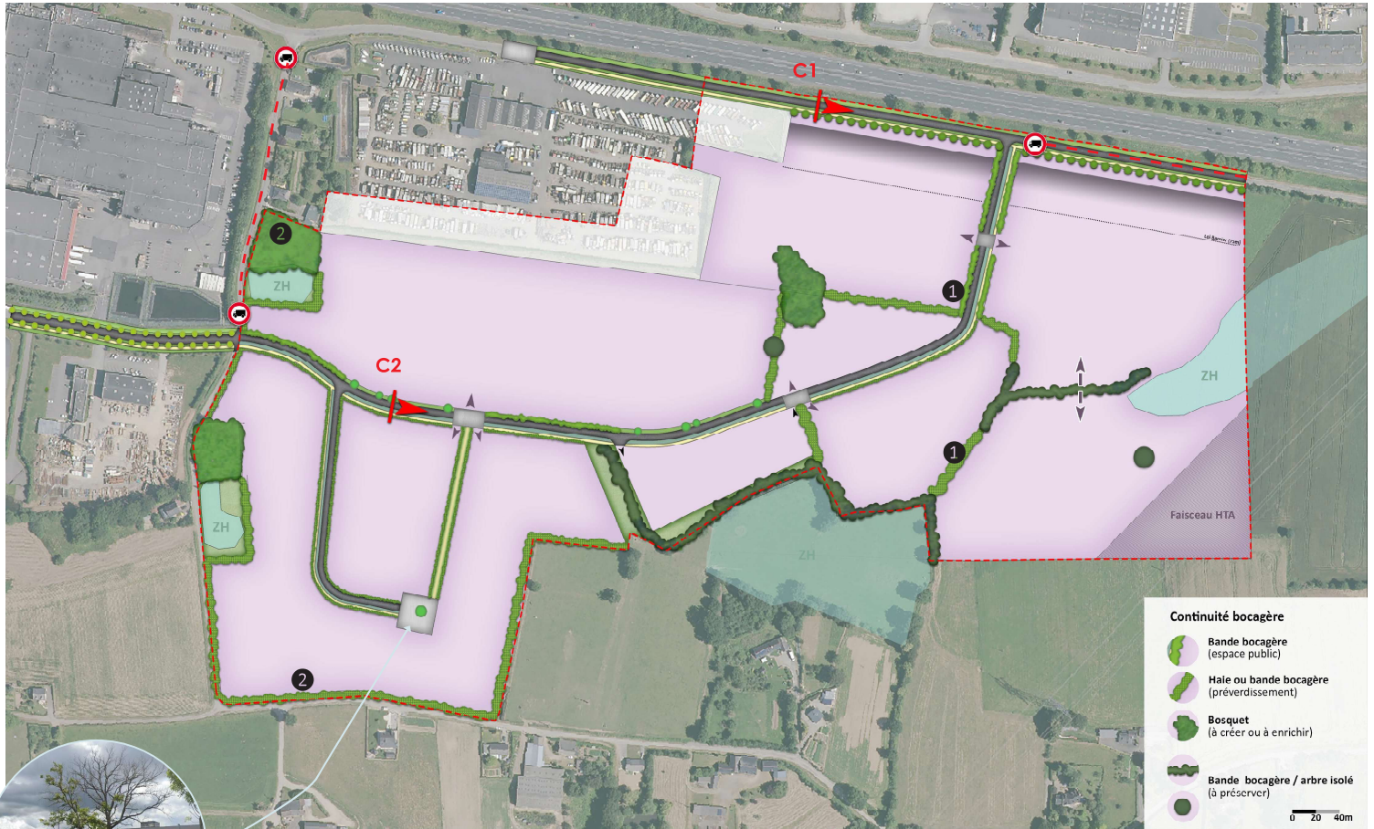
SCHÉMA DE PRINCIPE PRÉSENTÉ À TITRE INDICATIF ET SUSCEPTIBLE DE CHANGEMENTS :